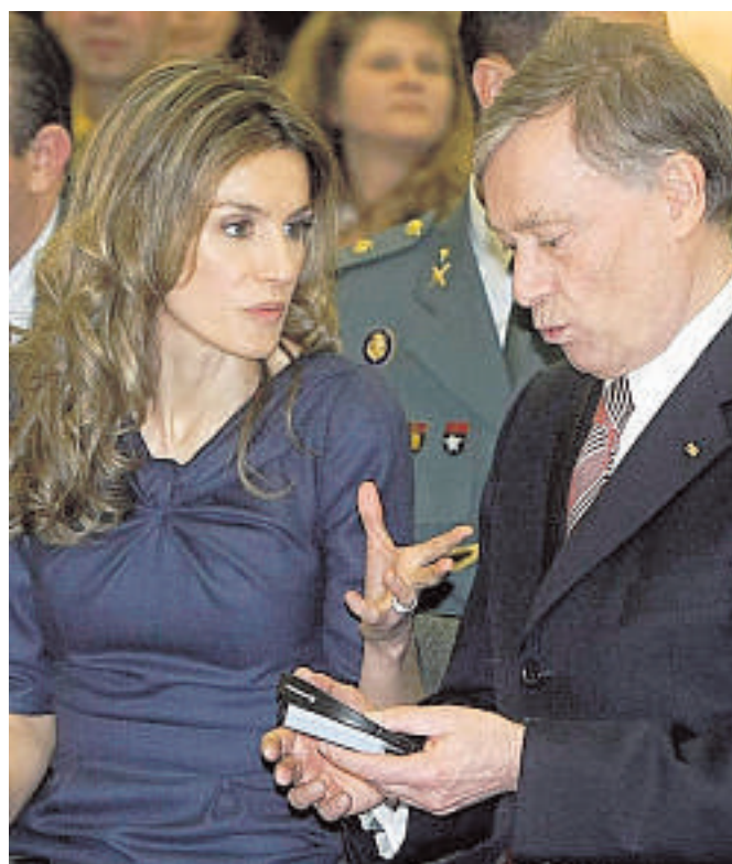
Doña Letizia, ayer en Berlín, junto al presidente alemán Horst Köhler

Sin embargo, Hertfelder baraja una segunda hipótesis y es que la dispensación de la Píldora del Día Después —abortiva en buena parte de las ocasiones— sin receta haga que el crecimiento de los abortos quirúrgicos se sitúe en torno a tres ciento anual. «Este segundo escenario —apunta— no es mucho menos dramático pues España sería en 2020 el tercer país con